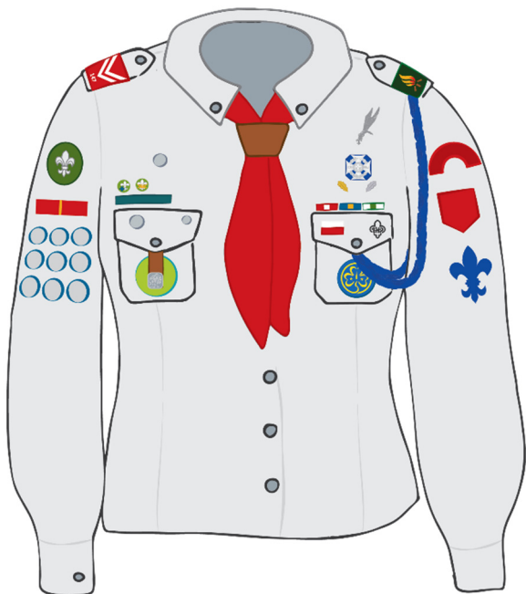
MUNDUR HARCERSKI MĘSKI