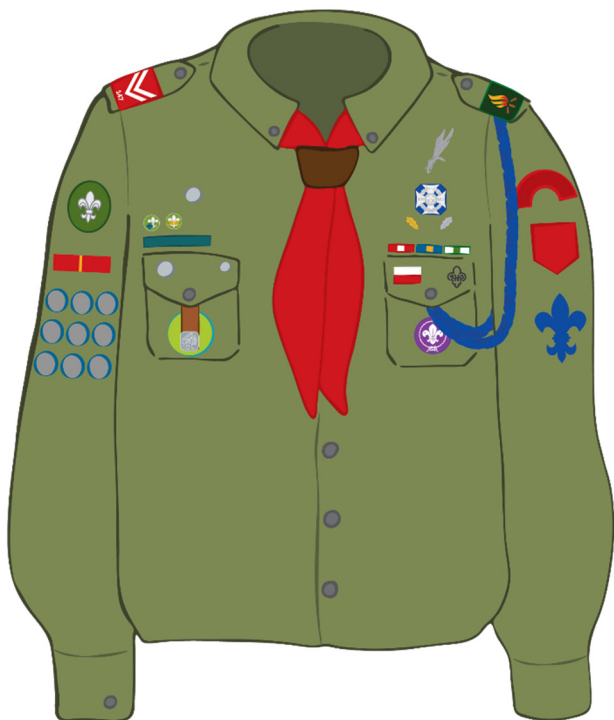
MUNDUR HARCERSKI MĘSKI