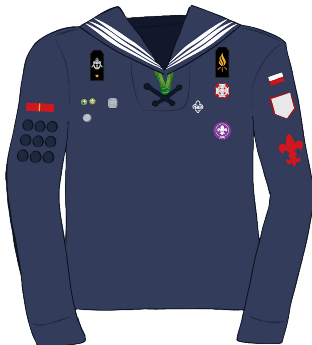
MUNDUR WODNY ZUCHOWY